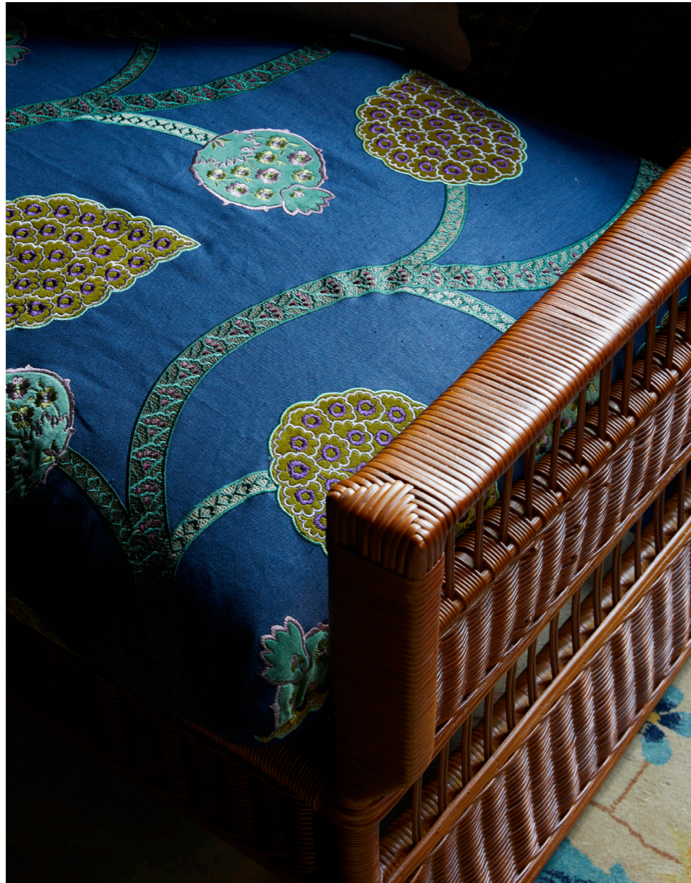
Starring Champagne Bar Club Chair in giunco e midollino con finitura all'anilina Tabacco. Tessuto Pierre Frey Le vizir Design Mario Bonacina e Renzo Mongiardino