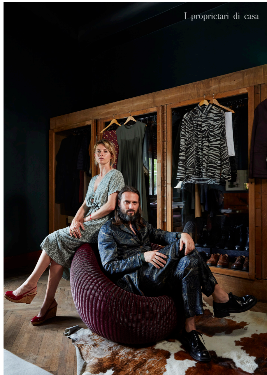
I proprietari di casa

In camera da letto, l'armadiatura è protagonista grazie alle vetrine che mostrano file di abiti, scarpe e accessori.